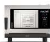
4 GN 1/1