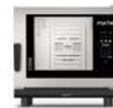
6 GN 1/1