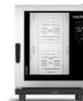
10 GN 1/1