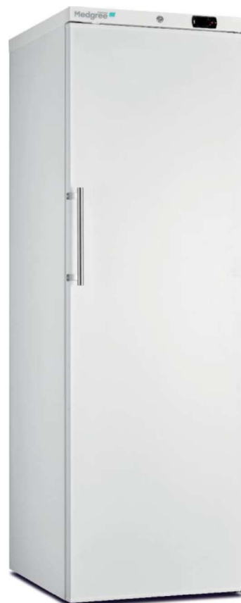
MLF 450 S