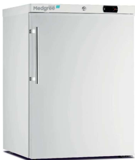
MLF 150 S