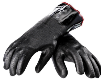
Rękawice do pieca