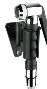
Zestaw prysznica Nr kat.: 651202 Ilość: 1 szt.