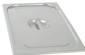
GN 1/1 pokrywka Nr kat.: 111000 Ilość: 3 szt.