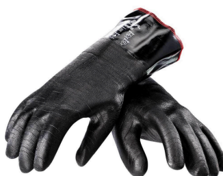
Rękawice do pieca Nr kat.: 505020