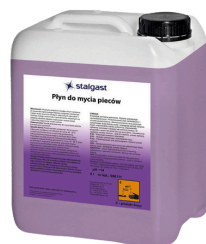
Płyn do mycia pieców 5 l.