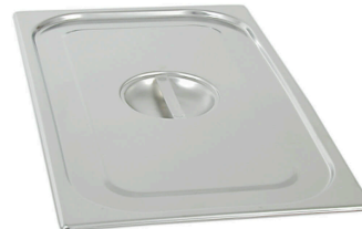
GN 1/1 pokrywka