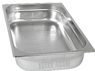
GN1/1 perforowany 40mm Nr kat.: 121044 Ilość: 7 szt.