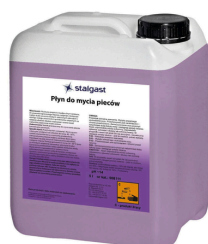
Płyn do mycia pieców 5 l. Nr kat.: 908111