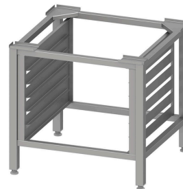
Podstawa pod piec h=650 mm