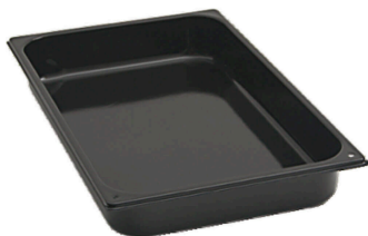
Blacha emaliowana do pieczenia