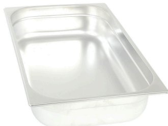
GN 1/1 pełny 65 mm Nr kat.: 111060 Ilość: 7 szt.